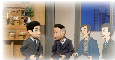
자택 2층에서 신앙을 함께하는 사람들과 성제를 시작함