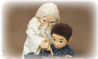
하느님께 글을 배움