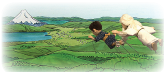
하느님과 하늘을 날아 심산 등을 감