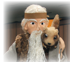
산막에서 거한(하느님)을 만남