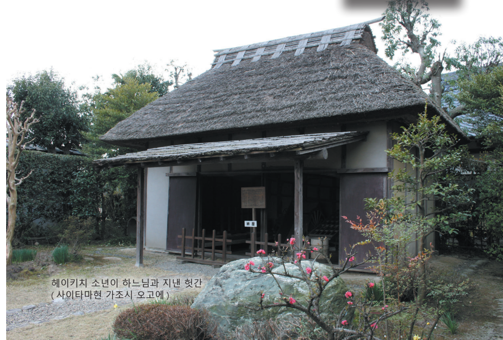
헤이키지 소년어 하느님과 지낸 곳 (사이타마현 가조시 오고에)