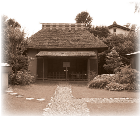
하느님과 헤이키치가 지냈던 헛간(사이타마현 가조시 오고에)