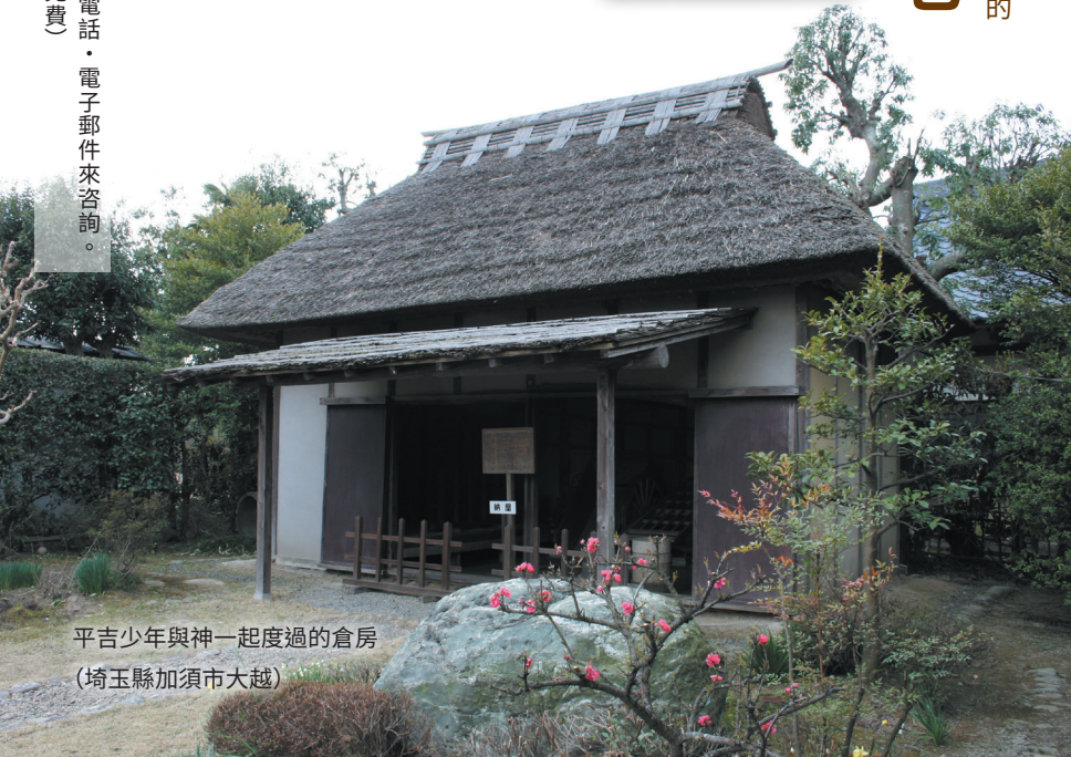
平吉少年與神一起度過的倉房 (埼玉縣加須市大越)