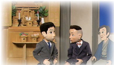
在自己家的二樓與信仰夥伴開始祭拜神