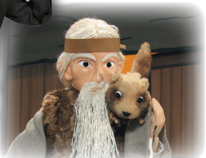
在山中小屋與大男人（神）見面