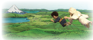
與神以空中飛行去深山等